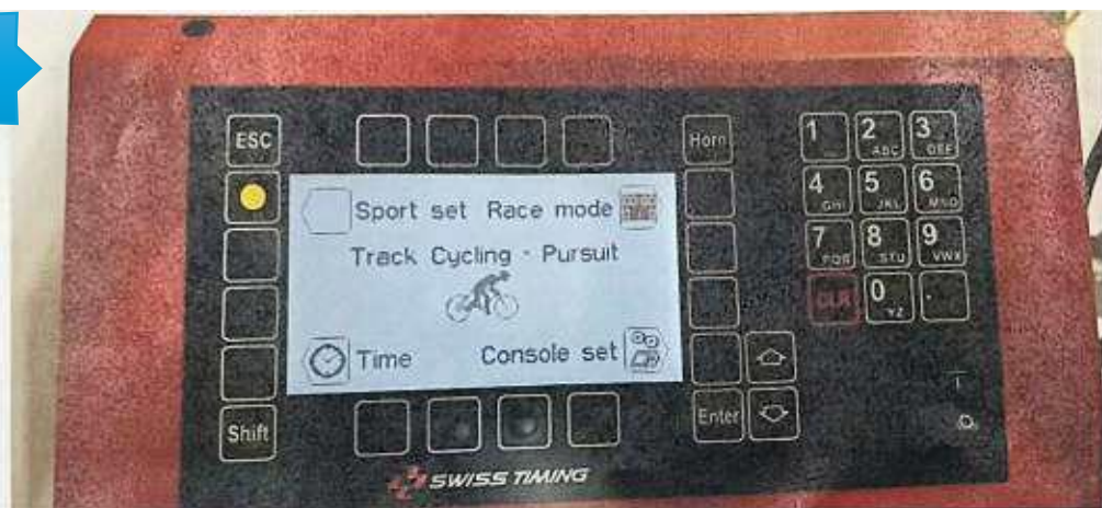
Page de base de la console

Pour paramétrer les réglages, appuyer sur le bouton (pastille jaune)